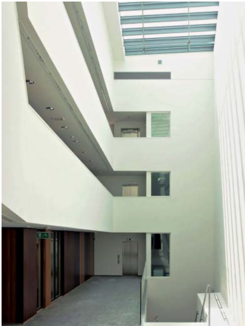
Das Atrium im Bürogebäude W16 über drei Geschosse. | The atrium in the office building W16 across three levels.

Im Mai wurde das Bürogebäude W16 fertig gestellt, an dem ich seit meinem Beginn bei Conix beteiligt war. Ansonsten