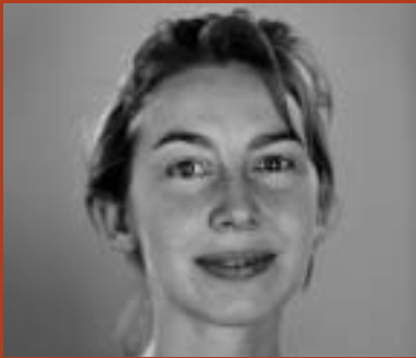
von | by Sophie Green

SOPHIE GREEN TELLS ABOUT HER APPRENTICESHIP AT CONIX ARCHITECTS.