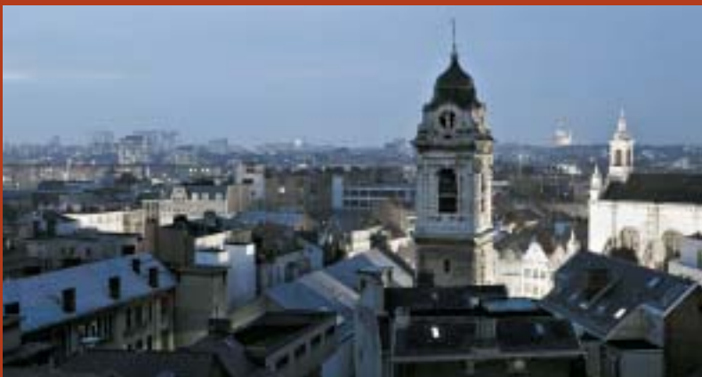
Winterliches Brüssel. | Winter in Brussels.